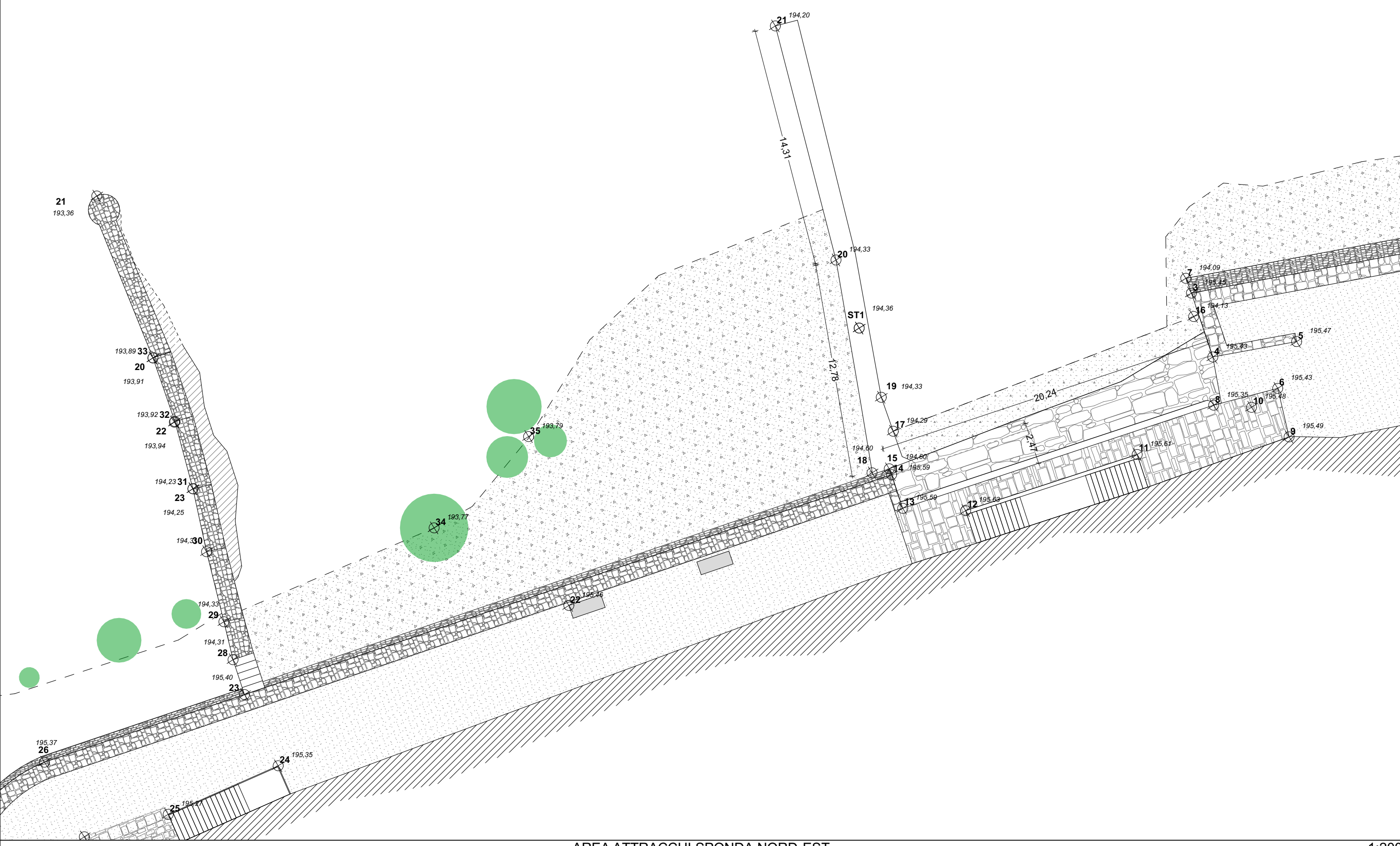
AREA ATTRACCHI SPONDA NORD-EST